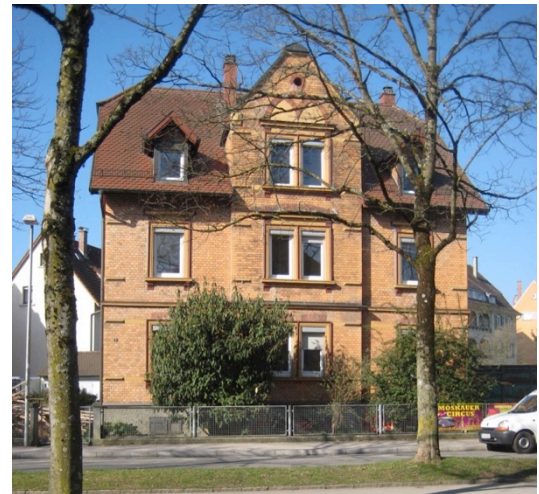
Ehem. Wohnhaus Riedleparkstraße 9

Die alte Stadtkasse an der Friedrichstraße, typisch für Einzelgebäude in der Architektur der dreißiger Jahre.