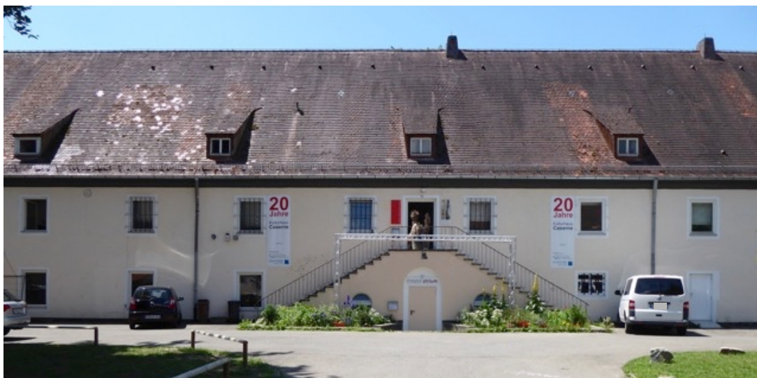
Flakkaserne - Offiziersgebäude