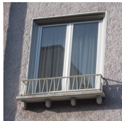
neue Details / alte Details