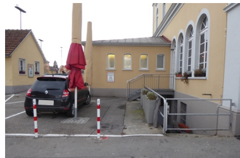
Außenbereich im Winter