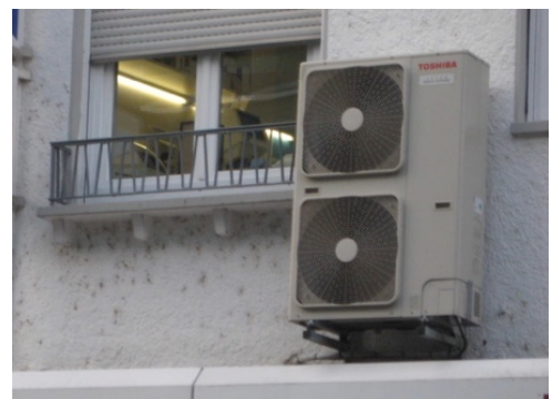
Klimagerät an unpassender Stelle

Ein schlechtes Stadtbild entsteht auch durch geschmacklose Kleinigkeiten zum Beispiel ein deplatziertes Klimagerät, wilde Reklame, Plakate, schreiende Werbetafeln und eine Vielzahl „genehmigungsfreier“ An-, Auf-, Aus- und Umbauten an Gebäuden und Anlagen sowie durch Gerümpel, das zwar auf privatem Grund steht, aber im öffentlichen Raum gut sichtbar ist, z. B. neben der Friedrichstraße.