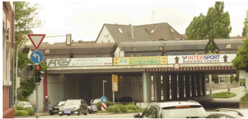
Reklametafeln und Plakate überall

In der digitalen Version nicht vorhanden.