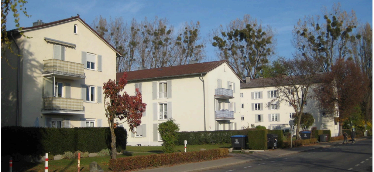
Wohnanlage an der Eckenerstraße, Straßenseite