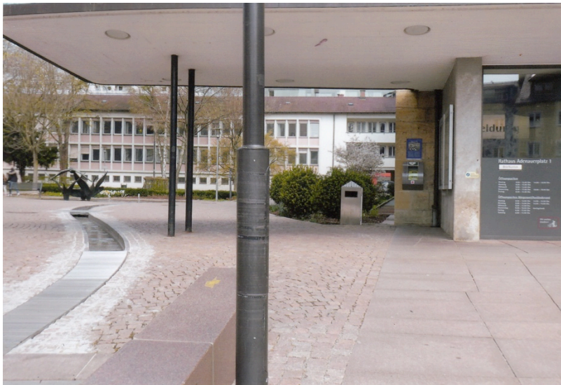
Rathausareal: Blick Rathauseingang zum Gebäudeflügel (ehem. Zollamt)

Erst nachdem Wohngebäude in großer Zahl wiederaufgebaut worden waren, wurde mit dem Bau des neuen Rathauses (denkmalgeschützt) und dem zunächst als Zollamt genutzten Gebäudeflügel 1956 ein Ensemble geschaffen, das zusammen mit der wiederaufgebauten Nikolauskirche einen kommerzfreien Stadtmittelpunkt schuf. Dieser Gebäudeflügel entspricht in seiner Architektur der des Rathauses; sie ist typisch für diese Zeit. Sie ist es wert, mit neuem Inhalt gefüllt zu werden, einem Inhalt, der kulturell orientiert und standortgerecht ist und das Ensemble erhält. Ein Abbruch des Gebäudeflügels (wie bereits gefordert) wäre unverzeihlich.