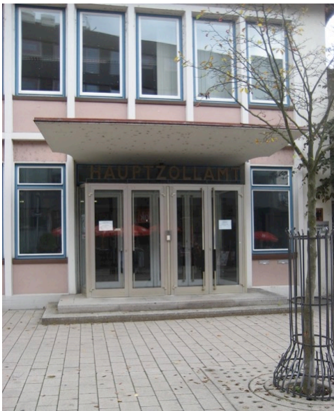
Eingang ehem. Zollamt