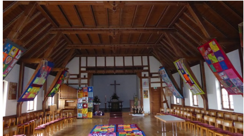
Evangelische Kirche Manzell / Innenraum