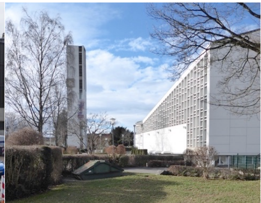
Kirche St. Maria / Gartenvorstadt Jettenhausen