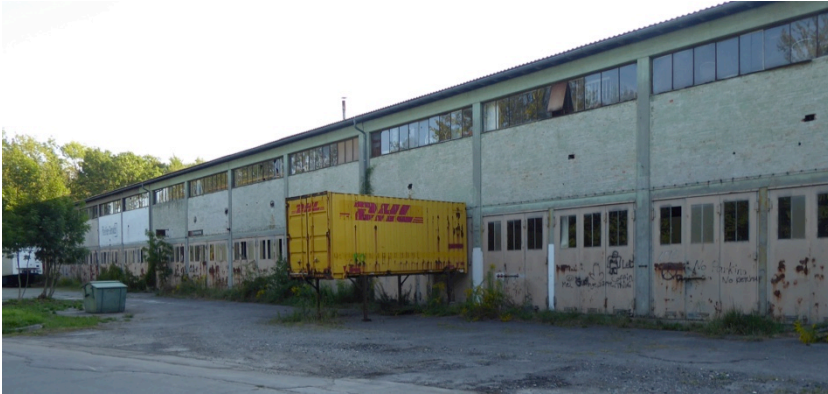
Flakkaserne - Fahrzeughalle