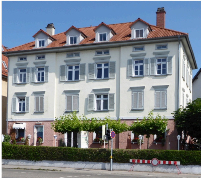
Wohn- und Geschäftshaus Ecke Olga-/Eugenstraße

An „königliche Zeiten“ erinnert noch die Architektur des Hauses an der Ecke Olgastraße/Eugenstraße und das ehemalige Schulhaus in Fischbach.