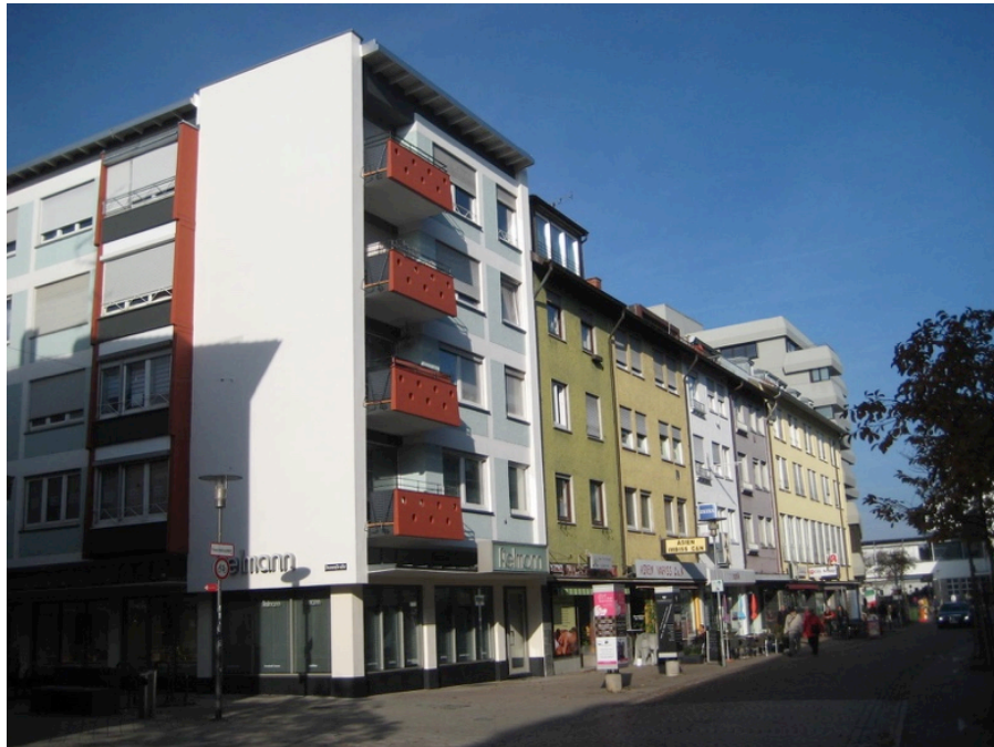
Wohn- und Geschäftshäuser an der Karlstraße

In den weiteren Jahren befreien sich die Gebäude und ihre Details von der bisherigen Einheitlichkeit. Flachdachgesimse und Balkonformen sind Zeichen neuer Architektur. Sie lassen das wenige Jahre zuvor Gebaute altmodisch erscheinen.