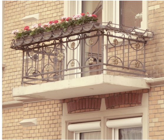
Detailaufnahme Hofenerstraße - Balkon

Mit drei und vier Geschossen entstanden stattliche Häuser mit städtischem Charakter an der Eugenstraße, der Metzstraße und der Bismarckstraße.