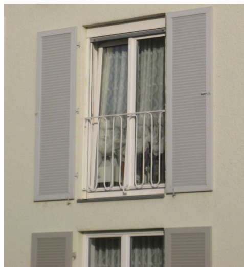
Fenstertür, Brüstungsgitter, Klappläden