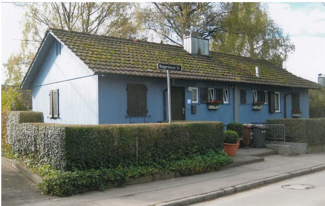
„Schweizerhäuser“ – Vorbild für Wohnen auf konzentriertem Raum