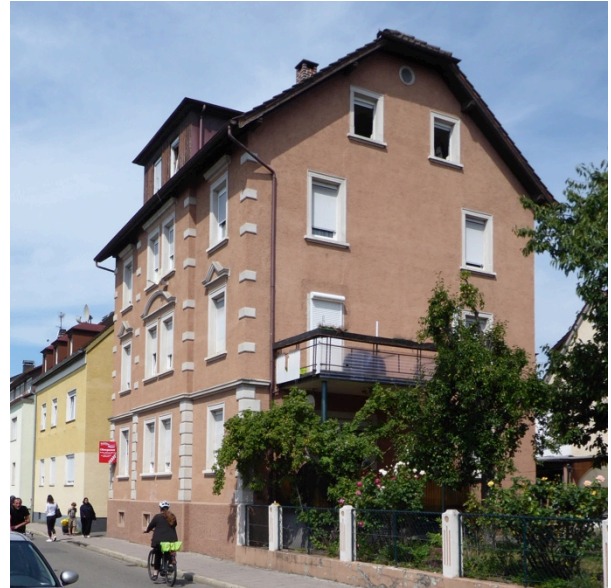
an der Bismarckstraße

Verspielt und romantisch sind das Haus Hirscher in der Charlottenstraße und das Haus an der Moltkestraße.