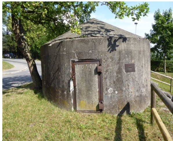
Kleinbunker an der Heinrich-Heine-Straße

Von den zahlreichen unterirdischen Schutzanlagen für die Bevölkerung ist heute nichts mehr zu erkennen. Ein oberirdischer Kleinbunker ist an der Heinrich-Heine-Straße erhalten.