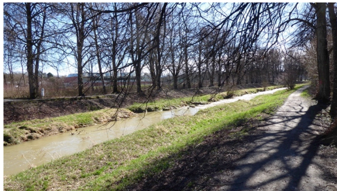
Grünzug an der Rotach