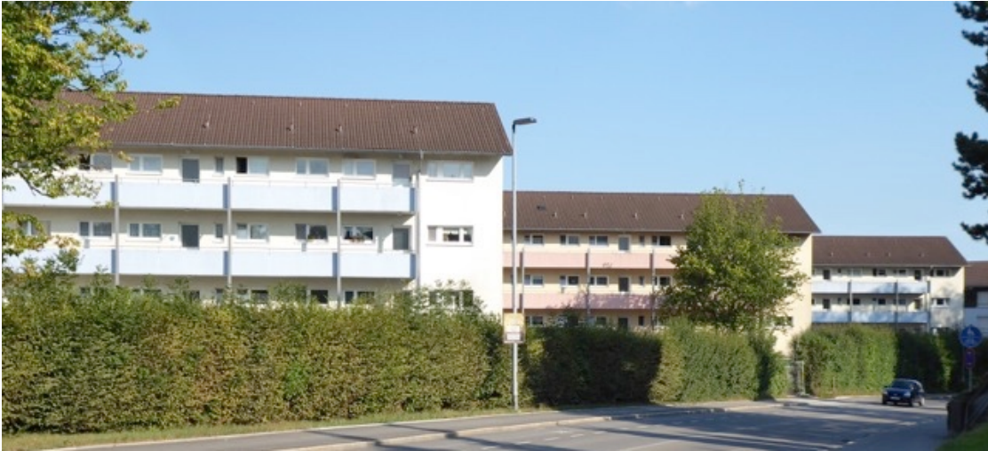
„Franzossiedlung“ an der Heinrich-Heine-Straße