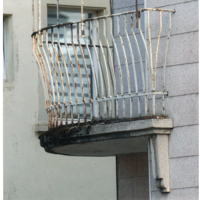
Schönes Balkongeländer an unschön gewordenem Haus