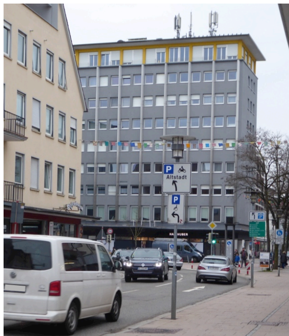
„Orion“-Hochhaus Friedrichstraße / Eckenerstraße

Zeittypisch „modern“ war das erste in der Stadt erbaute „Orion“-Hochhaus an der Friedrichstraße (1954), heute mit umgestalteter Fassade.