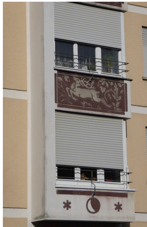
Detail Erker mit figürlichem Schmuck