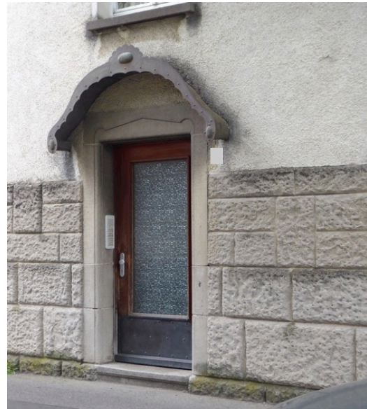
Ernst-Lehmann-Straße - Hauseingang