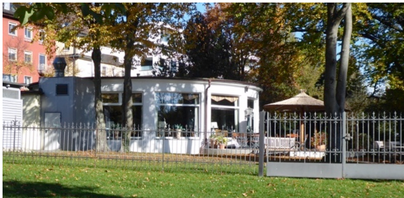
im Uferpark: historischer Pavillon

Im Uferpark ist der Rundbau des Pavillons erhaltenswert (derzeit leider verunstaltet durch Zäune und wilde Anbauten) sowie die lange Pergola unmittelbar an der Uferpromenade.