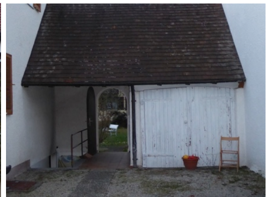
Garage - gedeckter Platz mit Durchgang zum Garten

Zur Förderung des Wohnungsbaus war 1935 in Friedrichshafen die „Württembergische Bodensee-Siedlungs-GmbH“ gegründet worden. Diese besorgte als „Neue Heimat“ den Bau von Mietwohnungen für Rüstungsarbeiter in mehrgeschossigen Häusern, kurz vor Kriegsbeginn mit den Wohnanlagen Mühlösch, Schreienesch/Hohenstaufenplatz und Meistershofen. Diese Wohnanlagen sind bemerkenswert, weil sie nach ihrer Modernisierung und der Umfelderneuerung in den 80er Jahren auch heute noch preisgünstiges Wohnen inmitten von großflächigem Grün ermöglichen.