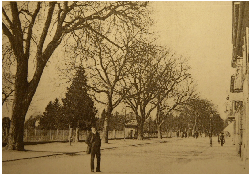
hist. Foto: Friedrichstraße mit Baumreihe

Ebenso erhaltenswert ist die erst vor wenigen Jahren nach historischem Vorbild wiederangelegte Baumreihe am „Promenade-Weg“ auf der Südseite der Friedrichstraße und die zum Seeufer hinabführenden Rampenwege, der „Lammgarten“, aber auch weitere „grüne Wege“ im Stadtbereich, wie die Allee der Riedleparkstraße, die Allee an der Mühlöschstraße, der Grünzug an der Rotach, der Grünzug an der Hans-Böckler-Straße und die Grünflächen im Bereich der historischen Wohngebiete (siehe Abschnitt: Die Zeit zwischen den beiden Kriegen).