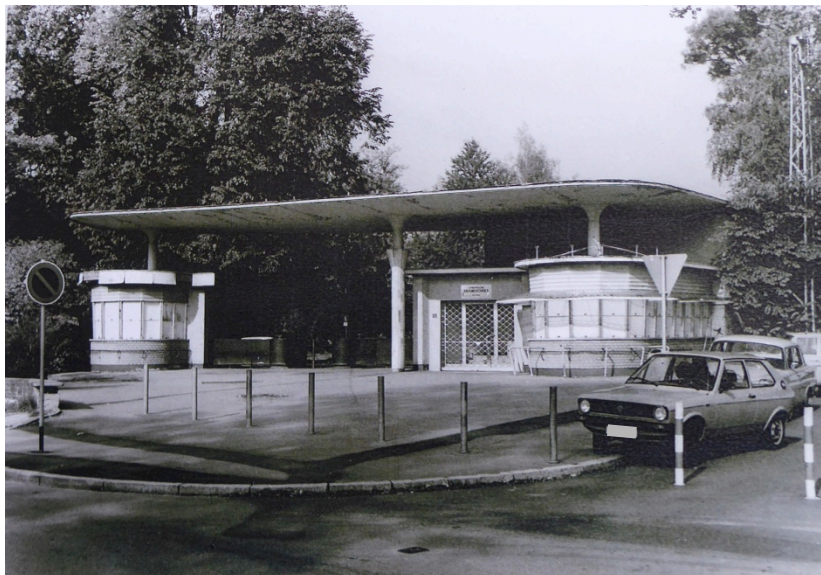
Ehem. Eingangsgebäude der IBO-Messe (hist. Fotos)