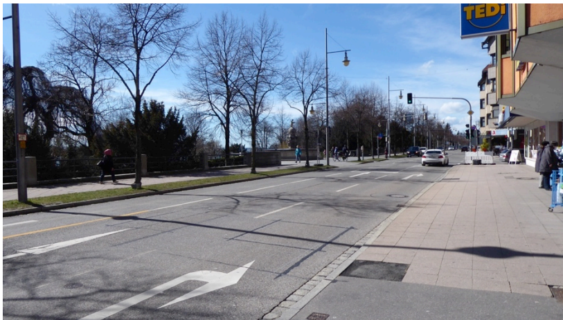
Friedrichstraße heute mit Baumreihe