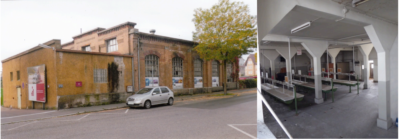
Halle und Innenraum

Beachtenswert sind die im Lauf des Betriebs erstellten unterschiedlichen Gebäude, sie zeigen in enger Nachbarschaft die konstruktive und formale Entwicklung des Industriebaus. Bei einer Neunutzung des Areals könnten sicher weitere Gebäudeteile in die Planung integriert werden und damit an die historische Funktion des Areals erinnern.