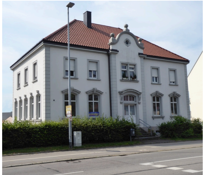
Ehem. Schulhaus in Fischbach