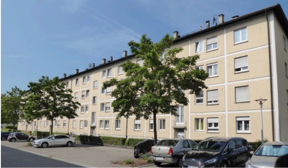
Mehrfamilienwohnhaus Ernst-Lehmann-Straße, Eingangsseite