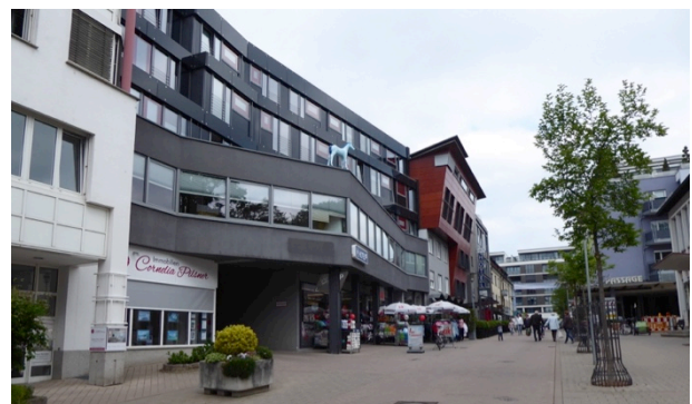
an der Schanzstraße