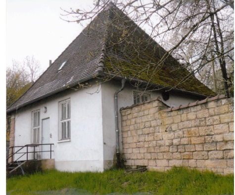
Flakkaserne - Wachpostengebäude an der Hochstraße

Von den zahlreichen unterirdischen Schutzanlagen für die Bevölkerung ist heute nichts mehr zu erkennen. Ein oberirdischer Kleinbunker ist an der Heinrich-Heine-Straße erhalten.