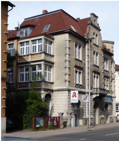
Ehem. Zeppelinapotheke, Eugenstraße

Mit drei und vier Geschossen entstanden stattliche Häuser mit städtischem Charakter an der Eugenstraße, der Metzstraße und der Bismarckstraße.