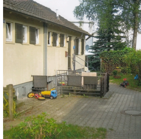
„Schweizerhäuser“ - Gartenbereich