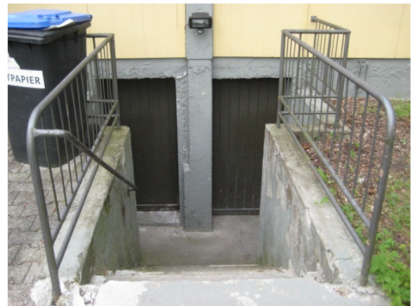
Platzsparend - gemeinsamer Kellerabgang