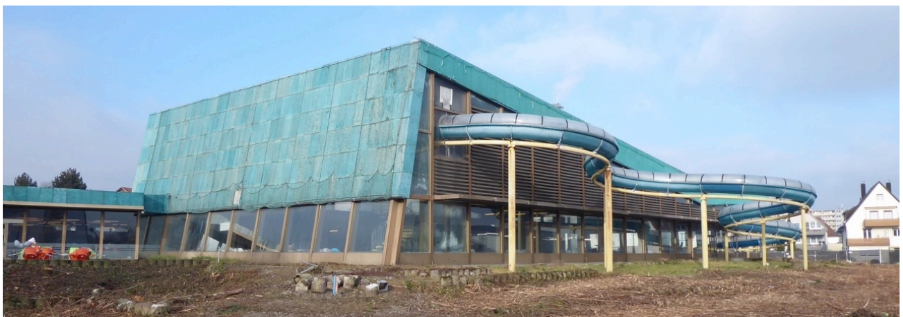
Hallenbad an der Ehlerstraße