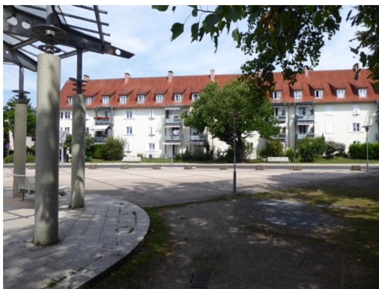
Wohngebiet Schreienesch (Hohenstufenplatz)