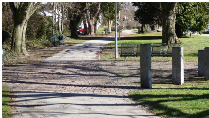
Grünzug an der Hans-Böckler-Straße