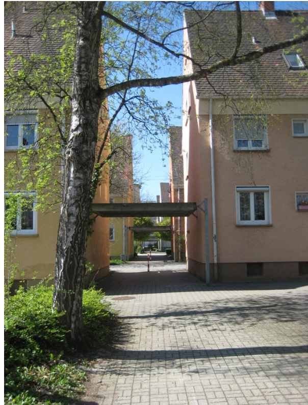
Mühlösch: von Pergola überdeckter Verbindungsweg