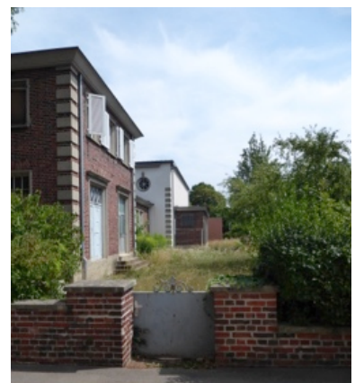
Technikgebäude an der Paulinenstraße