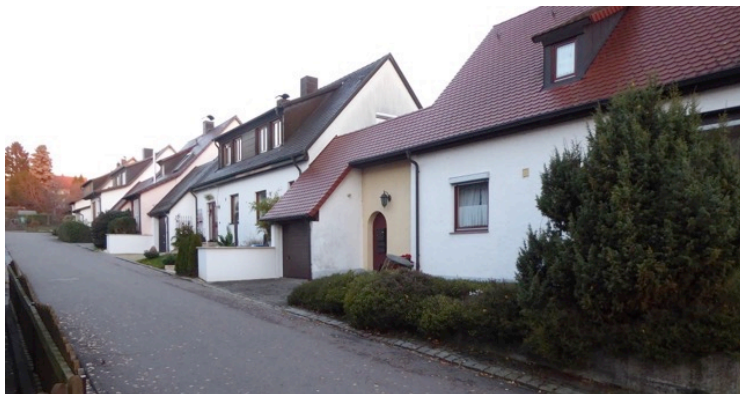
Einfamilienhäuser in der Dorniersiedlung