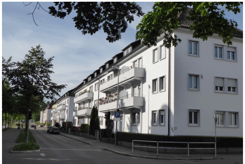
Wohngebäude für französische Offiziere an der Riedleparkstraße