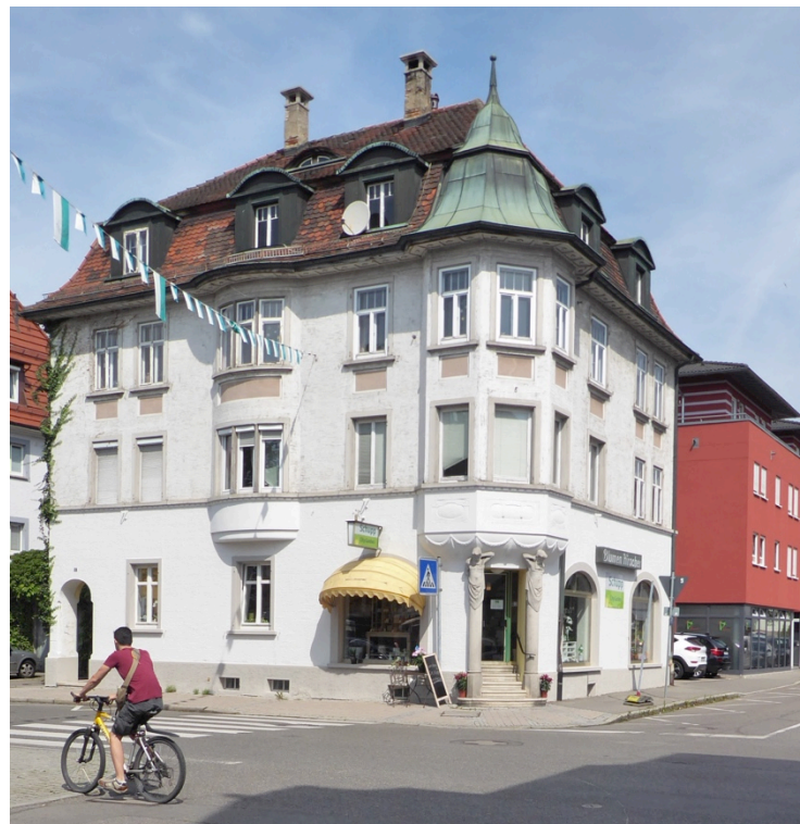
Ehem. Blumenhaus Hirscher, Charlottenstraße

Verspielt und romantisch sind das Haus Hirscher in der Charlottenstraße und das Haus an der Moltkestraße.