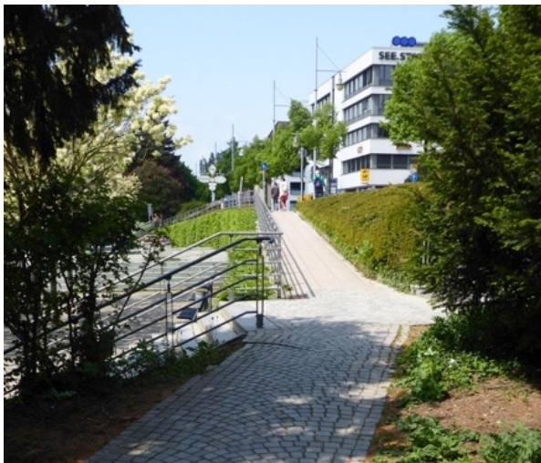
stufenlose Wege zum Uferpark