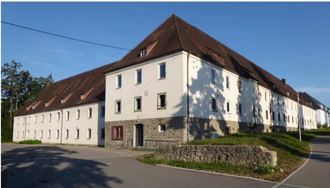
Ehem. Flakkaserne Fallenbrunnen, Mannschaftsgebäude

Eine militärische Großanlage ist die ehemalige Flakkaserne im Gebiet Fallenbrunnen. Typisch sind deren einheitliche Gebäudeform, die solide Bauweise und viele kleine Baudetails, die das fachliche Können der damals am Bau Beteiligten zeigen.