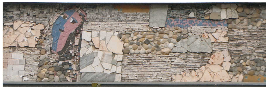
Neue Materialien, neue Kunst