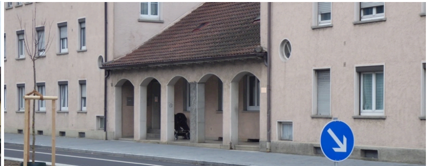
Mehrfamilienwohnhaus an der Keplerstraße / Hauseingang