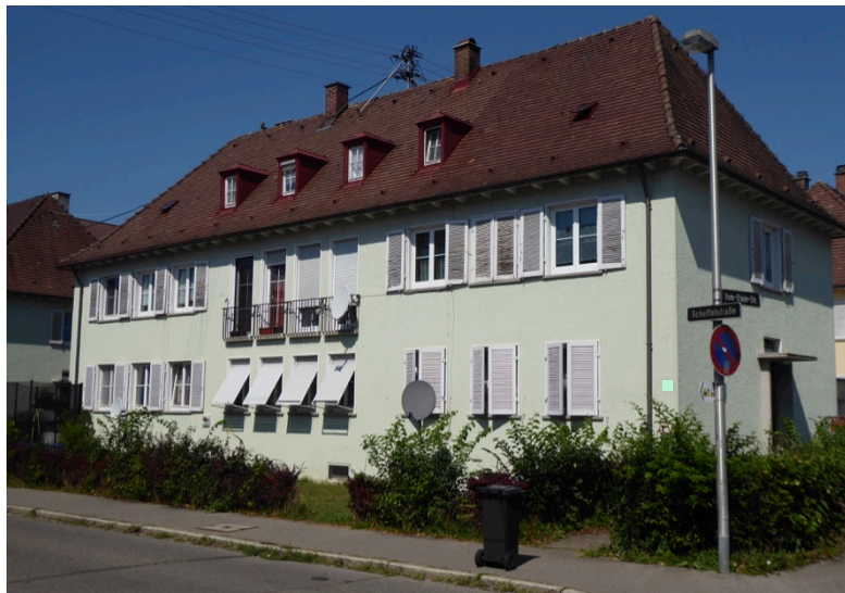
Mehrfamilienwohnhaus an der Scheffelstraße

Auch wurden einheitlich konzipierte, kleine Einfamilienhäuser im Rahmen der Schmitthennersiedlung (denkmalgeschützt), der Löwentalsiedlung und der Dorniersiedlung erstellt. Letztere ist bemerkenswert, weil hier - in unchristlich gewordener Zeit – die kleine evangelische Kirche an der Linzgaustraße gebaut wurde und danach - der Krieg hatte bereits begonnen – zu jedem Haus des zweiten Bauabschnitts bereits eine Garage gehörte. Die frühere Einheitlichkeit der Häuser ist heute jedoch kaum mehr erkennbar.