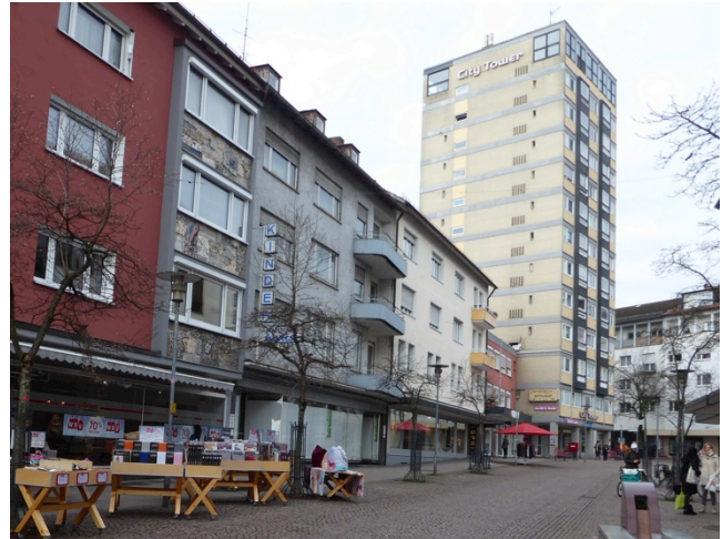
„Panzer“-Hochhaus am Buchhornplatz

Am Buchhornplatz entstand erst 1962, also einige Jahre später, das „Panzer-Hochhaus“ in moderner kubischer Form.