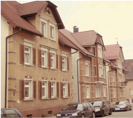
Gebäudegruppe an der Hofenerstraße