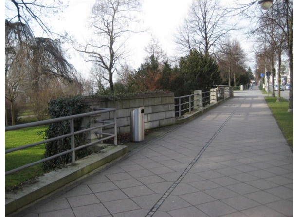
seeseitiger Gehweg an der Friedrichstraße