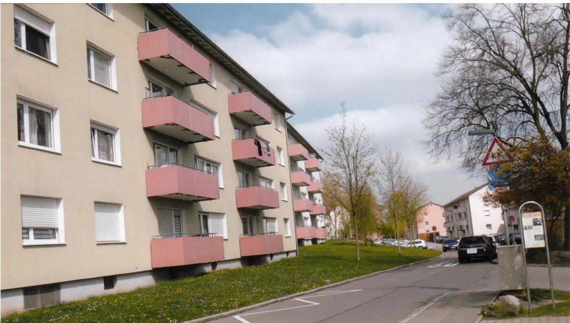
„Franzossiedlung“ an der Heinrich-Heine-Straße

Für die Aufnahme französischer Offiziersfamilien wurde eine Hausgruppe in typisch französischem Architekturstil in prominenter Lage an der Riedleparkstraße erstellt.