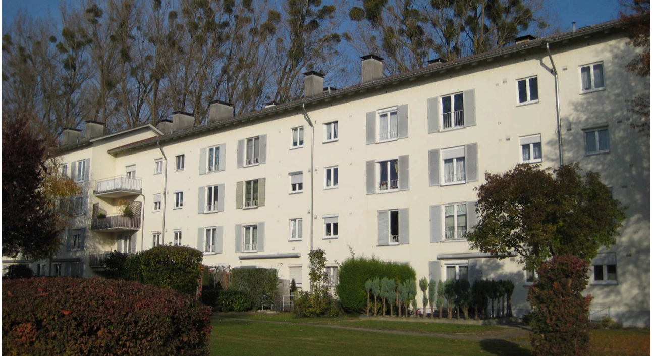
Wohnanlage an der Eckenerstraße, Gartenseite