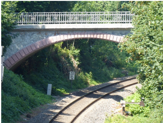
Brücke über die Bahnlinie nach Radolfzell (Schlossstr.)

Die in Richtung Radolfzell in einem Geländeeinschnitt als Bodenseegürtelbahn weitergeführte Eisenbahnstrecke erforderte den Bau einer Brücke (Schlossstraße) und des Bahnhofs Fischbach. Beide Bauten sind Zeitzeugen des Eisenbahnbaus am Bodensee.