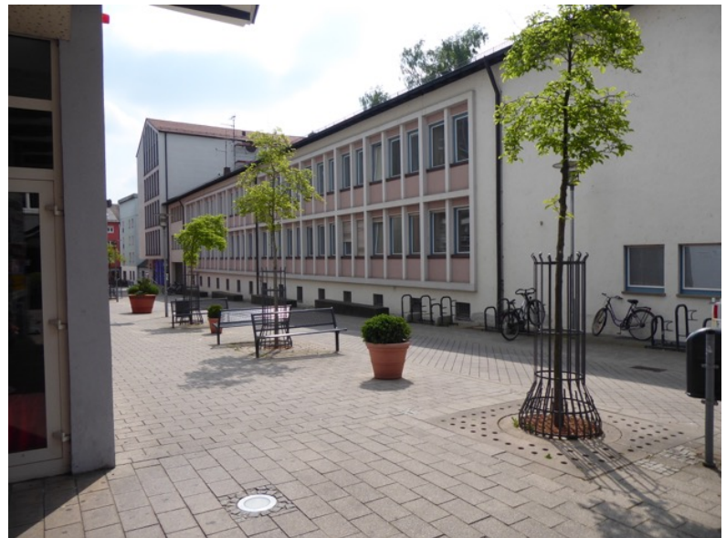
Ehem. Zollamt Straßenseite