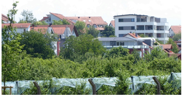
„abweichende“ Bauweise im Gebiet Oberhof

Neues Mehrfamilienwohnhaus im Gebiet Oberhof - Bebauungsplan?