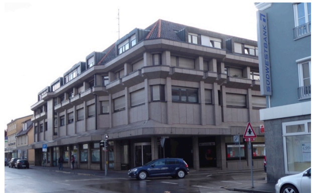
an der Charlottenstraße