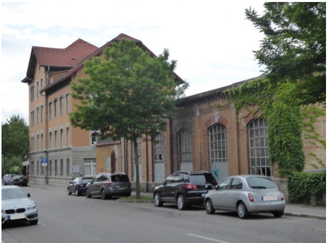
Verwaltungsgebäude und Halle an der Eugenstraße

Das Eisenbahnausbesserungswerk ist Wiege des Maschinenbaus in der Stadt. Es belegt eine an das Bahnhofareal angrenzende große Fläche mit Gleisanlagen, Lokschuppen und Werkstätten. Übrig geblieben ist heute noch eine etwas wilde Ansammlung von Hallen und Geschossbauten, zu verschiedenen Zeiten und in höchst unterschiedlichen Formen und Konstruktionen errichtet. Erhaltenswert ist außer dem Wasserturm (denkmalgeschützt), das Verwaltungsgebäude und die benachbarte kleine Halle mit schönem Innenraum, beide mit Sichtmauerwerk und Werksteinteilen.