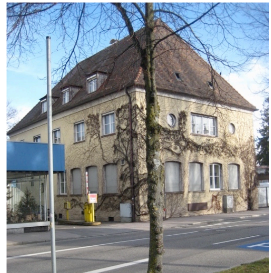
Ehem. Bankhaus / Alte Stadtkasse

Die alte Stadtkasse an der Friedrichstraße, typisch für Einzelgebäude in der Architektur der dreißiger Jahre.