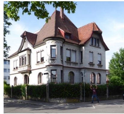
Historische Stadt villen an der Riedleparkstraße