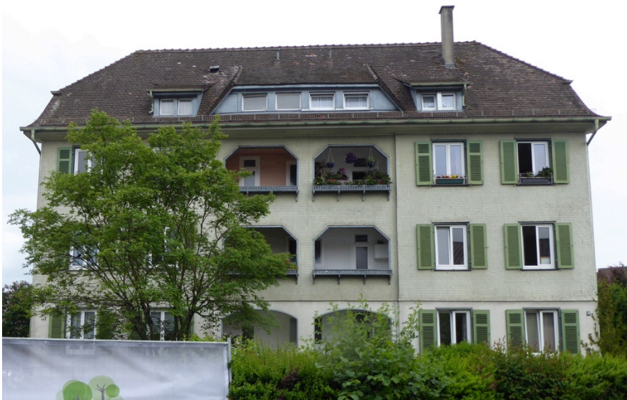
Dienstwohngebäude für EABW-Personal, Hofener Straße