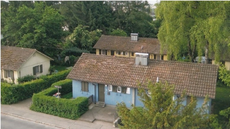
„Schweizerhäuser“ in Waghershausen

Eine Sonderform der Wohnungsversorgung sind die von der Schweiz gespendeten „Schweizerhäuser“ in Waghershausen. Sie wurden in Holzbauweise vorgefertigt und auf einer konventionell erstellten Teilunterkellerung aufgestellt (1953). Sie sollten zur Aufnahme von Sowjetzonenflüchtlingen dienen. Heute sind sie ein Beispiel dafür, wie einfache Bauten ein menschliches Wohnen ermöglichen.