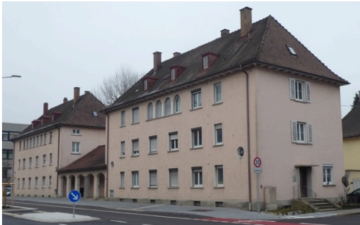
Mehrfamilienwohnhaus an der Keplerstraße

In der Zeit des Dritten Reichs erstellte die Zeppelin-Wohlfahrt größere Wohnhäuser im typischen Stil der „Stuttgarter Schule“. Beispielhaft sind die Gebäude im Gebiet „Stockwiesen“, an der Keplerstraße und an der Scheffelstraße.