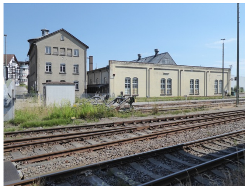
Geschossbau und Werkhalle