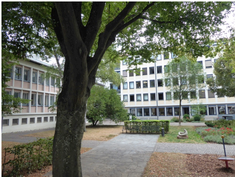
Rathausgebäude mit Gebäudeflügel (ehem. Zollamt)