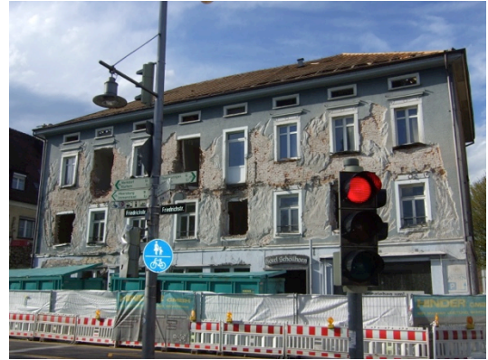
Ehem. Hotel Schöllhorn an der Friedrichstraße

Das Haus Riedleparkstraße 9 als typisches bürgerliches Wohnhaus aus der Zeit, in der sich die Stadt nach Norden entwickelte und die Riedleparkstraße mit ihrer Allee zur guten Adresse wurde.