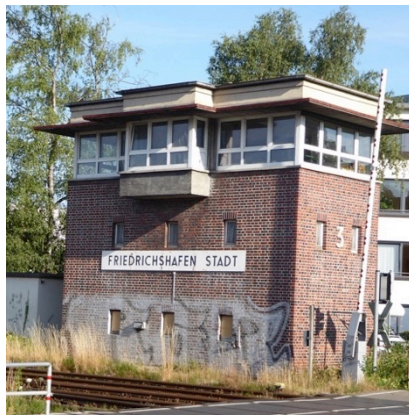
Stellwerk an der Olgastraße