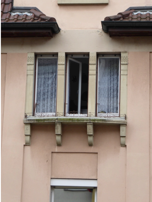
Fassadendetail am Haus Eugenstraße

Klassische Details sind auch an weiteren Gebäuden zu finden, schöne Bauteilreste sind auch an Häusern verblieben, deren Fassade nachteilig verändert worden ist.