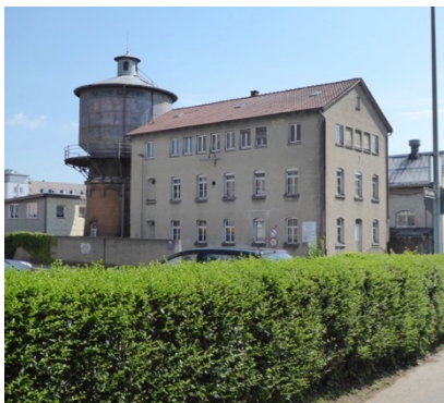
Wasserturm und alter Geschossbau