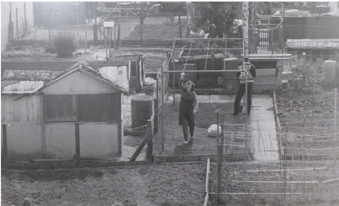
Meistershofen: hist. Nutzung der Freiflächen