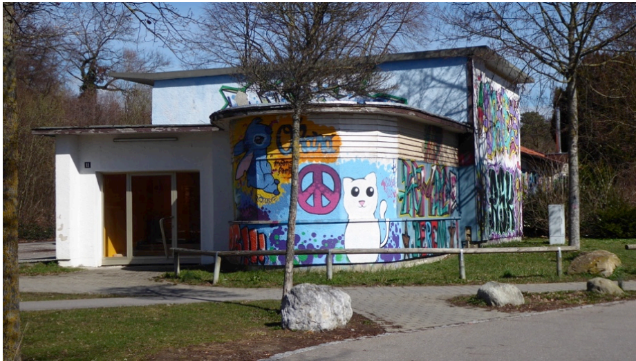
Ehem. Eingangsgebäude zur IBO-Messe am Riedlewald

Ehem. Eingangsgebäude der IBO am Riedlewald - in diesem Zustand am Maybach-Platz unpassend.