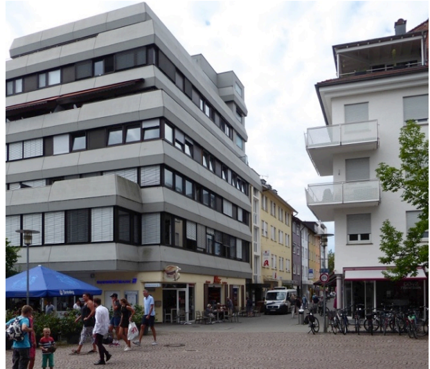
Fremde Gebäudeformen am Buchhornplatz

In der Folge wurden Großbauten ohne Rücksicht auf benachbarte Objekte nach individuellem Architektengeschmack errichtet z. B. am Buchhornplatz, an der Charlottenstraße, an der Schanzstraße.