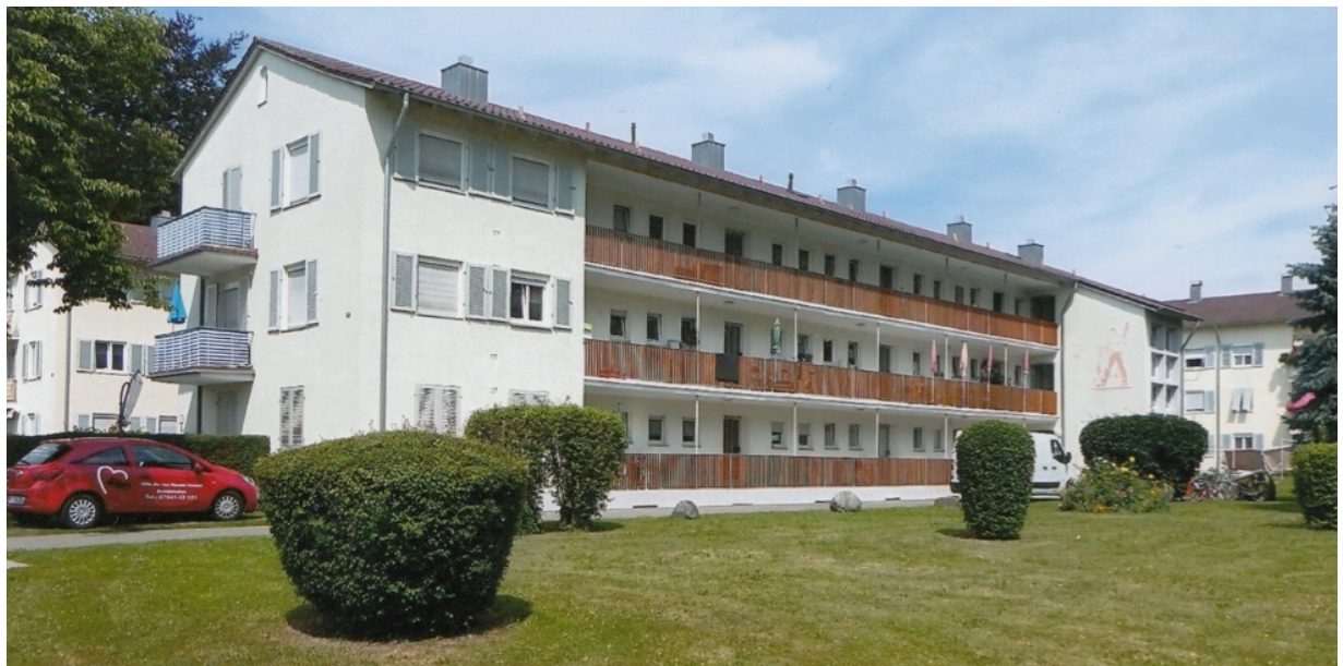
Wohnanlage an der Eckenerstraße, Eingangsseite