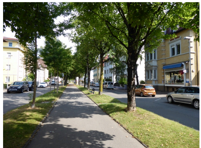
Riedleparkstraße - Parkallee