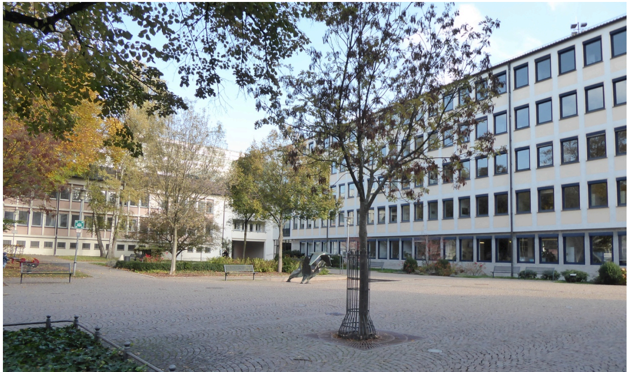
Innenhof Rathaus / ehem. Zollamt