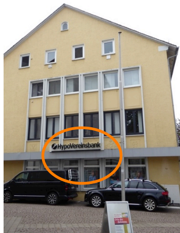
hist. Bildfries, verdeckt

Nachkriegsgebäude mit zeittypischem Bildfries, verdeckt durch neues Vordach und Firmenschrift: respektlos!