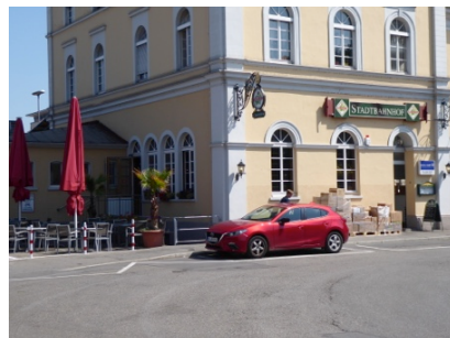
am Westgiebel: Außenbereich im Sommer