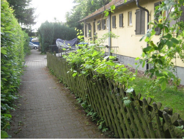
„Schweizerhäuser“ - Wohnweg