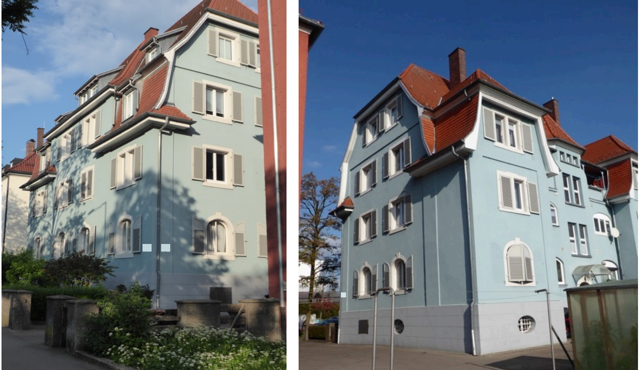
Ehem. Dienstwohngebäude für „Beamte“, Paulinenstraße

Formal aufwändig ist das Wohngebäude „für Beamte“ an der Paulinenstraße, erstellt zu einer Zeit, als diese nach Ravensburg führende Straße nur ein besserer Feldweg war.