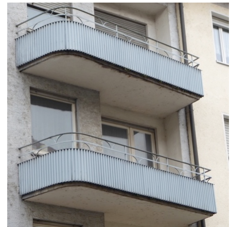
Wohn- und Geschäftshäuser am Buchhornplatz – neue Formen bei Fenstern und Balkonen